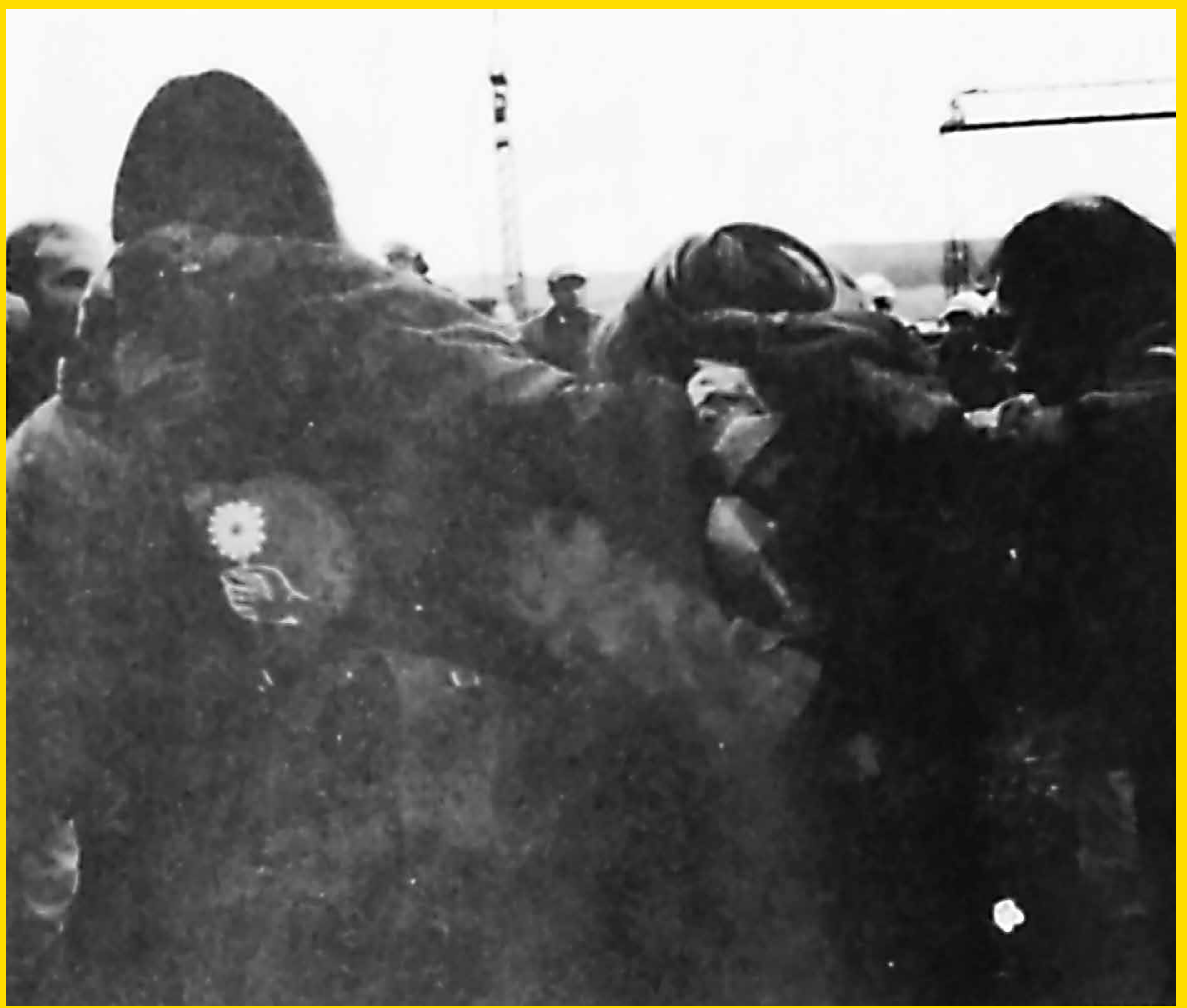
Fotos von der Platzbesetzung