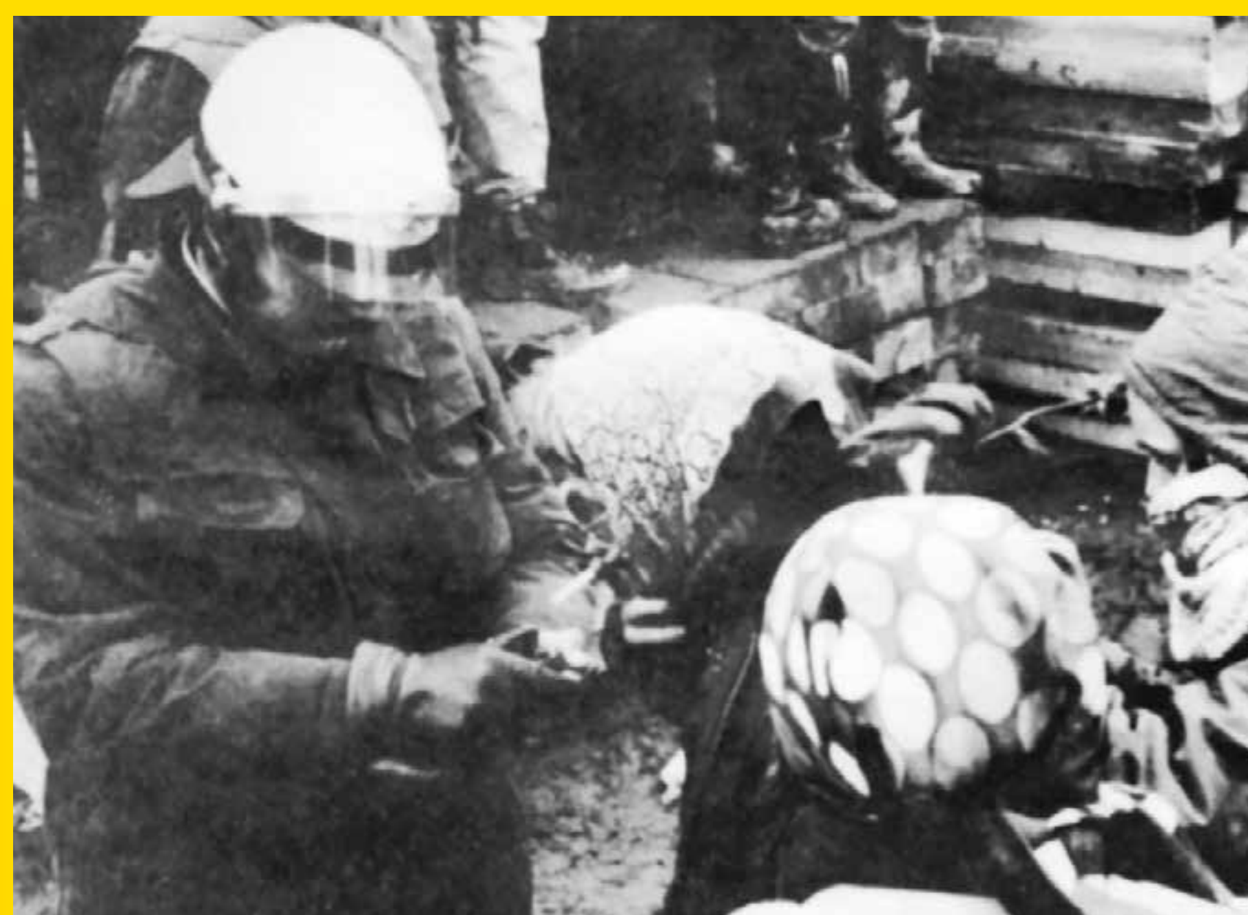
Ein Polizist gibt einer Demonstrantin Feuer.

Flugblatt der „Weserinitiative gegen Atomkraftwerke“ (gekürzt)